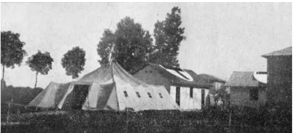
Tenda infermeria e baracche per ufficiali e soldati feriti. San Lorenzo di Fiumicello.